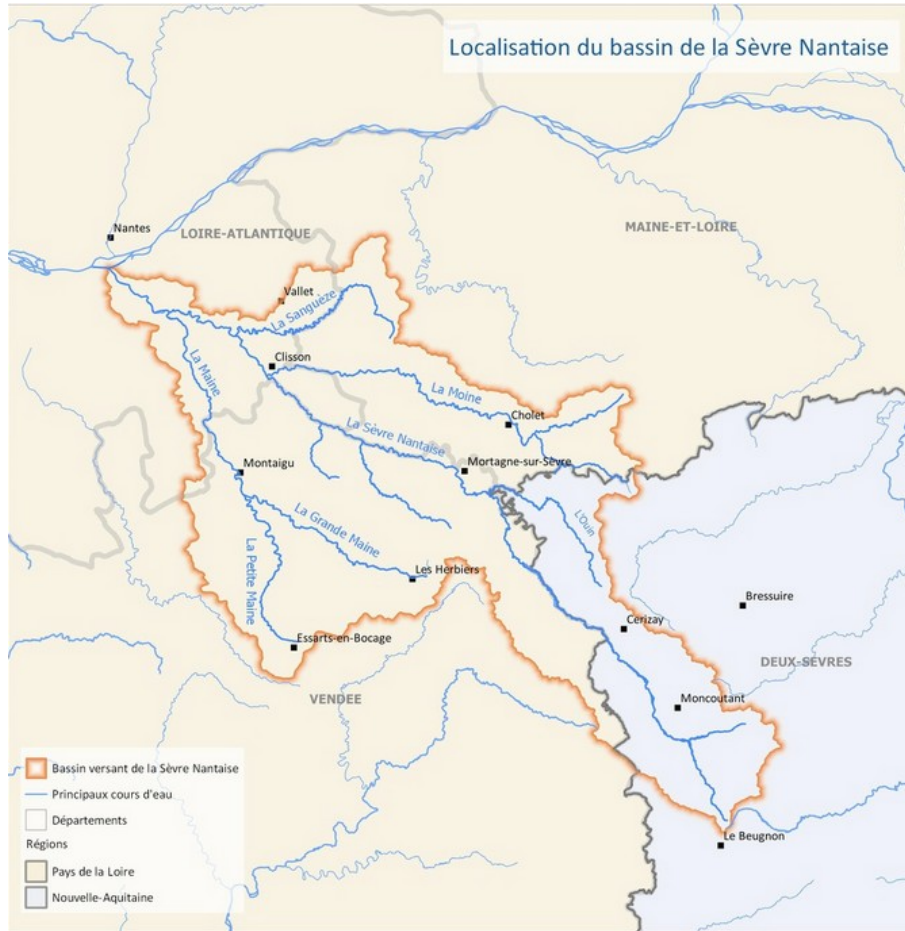
Le bassin versant de la Sèvre Nantaise